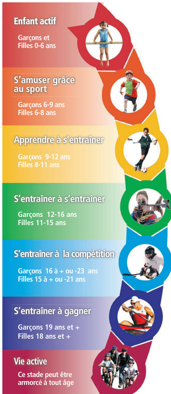
Modèle de développement à long terme de l'athlète - Au Canada, le sport c'est pour la vie